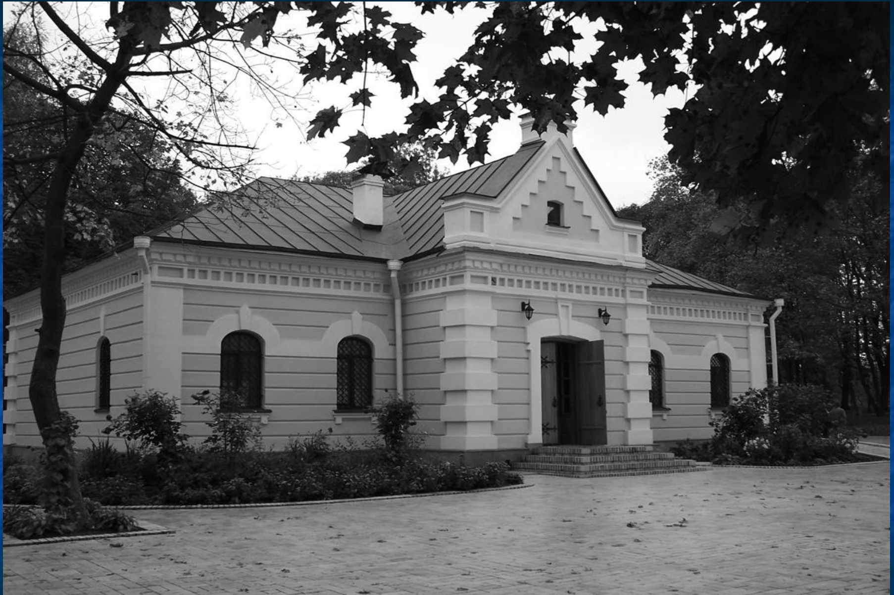
Будинок Генерального судді В.Кочубея в м. Батурині. Фото 2010 р.