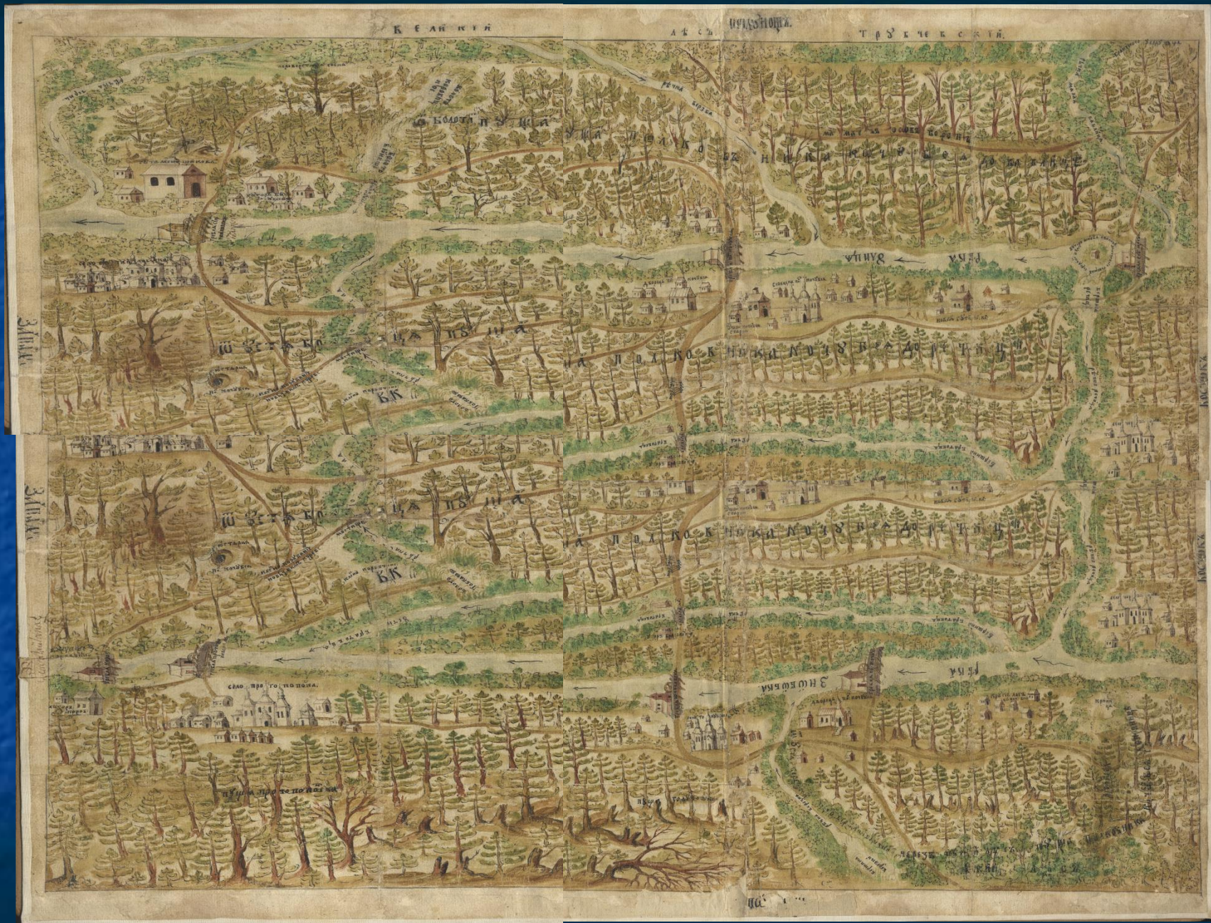
План володінь родини Кочубеїв у Старій Гуті. XVII ст.