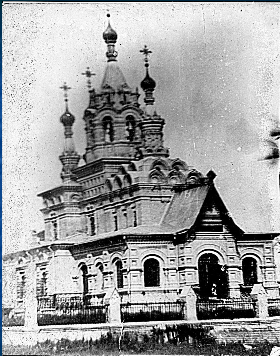
Церква Святого Миколая у с. Вороньки.