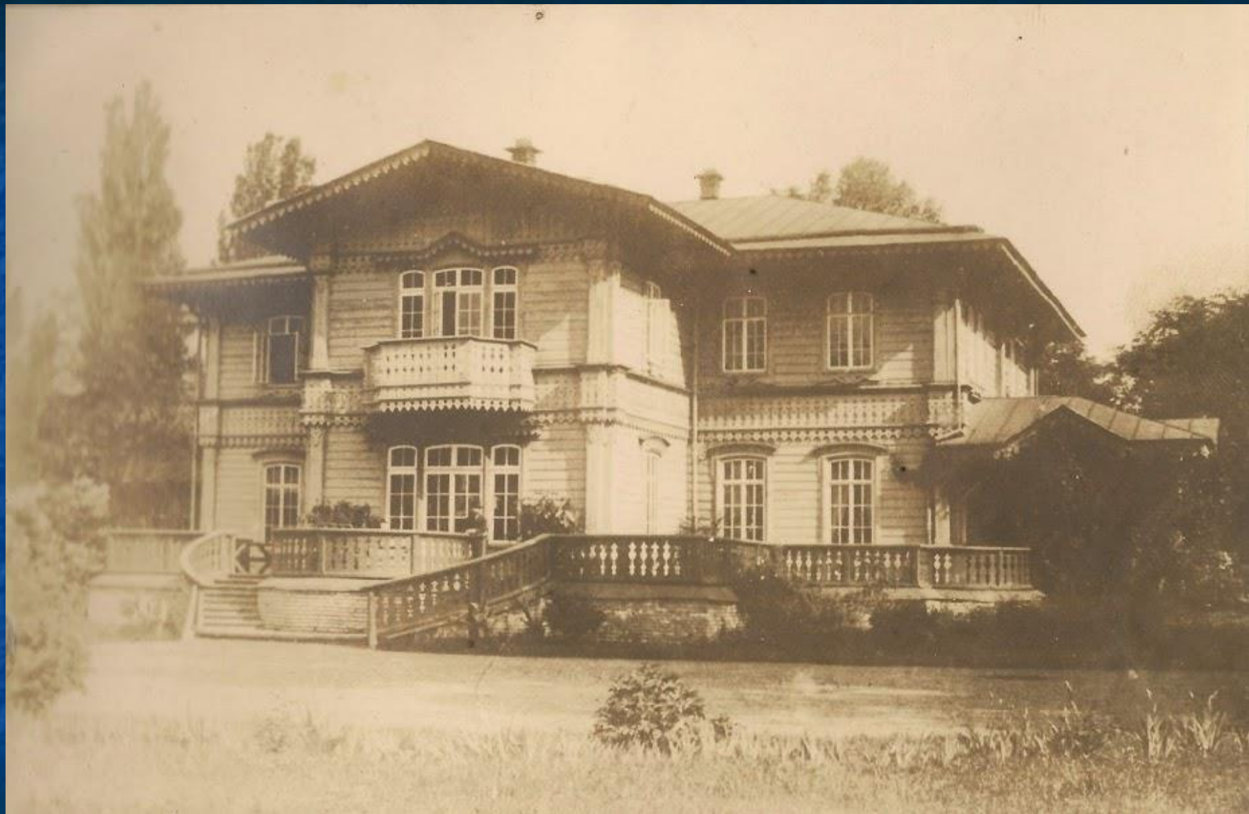
Будинок Кочубеїв у с. Вороньки. Фото середини XIX ст.