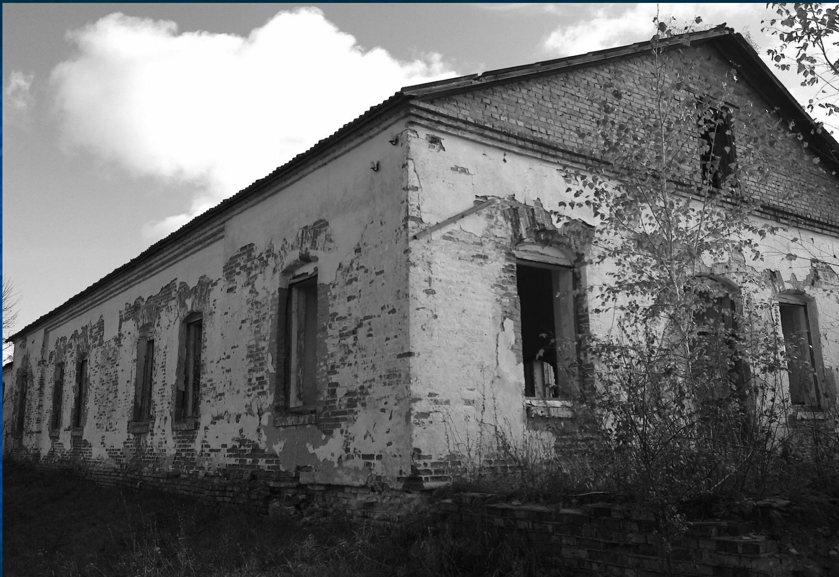
Приміщення Кинашівської школи, побудованої на кошти М.М. Кочубея. Фото 2011р.