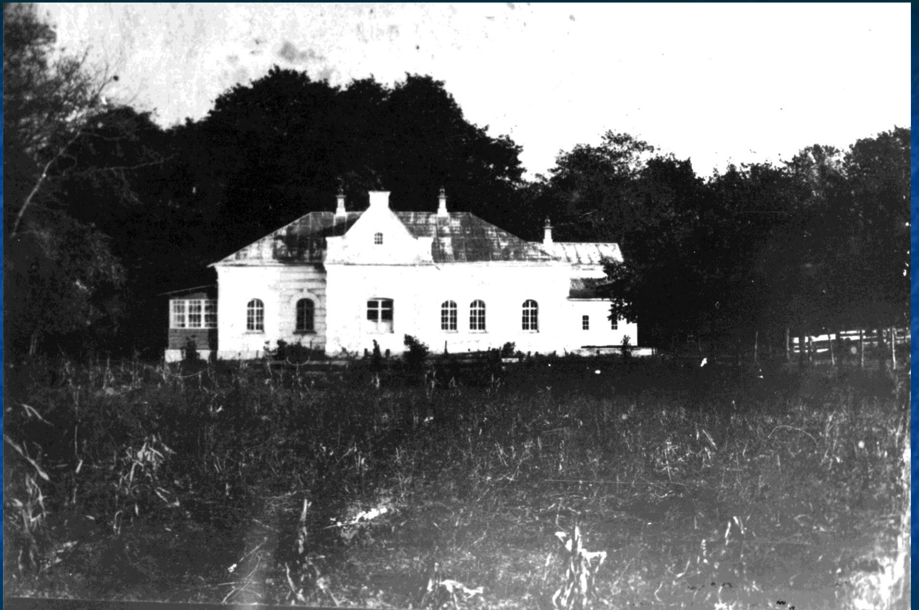
Будинок Генерального судді В.Кочубея в м. Батурині. Фото 1911 р.