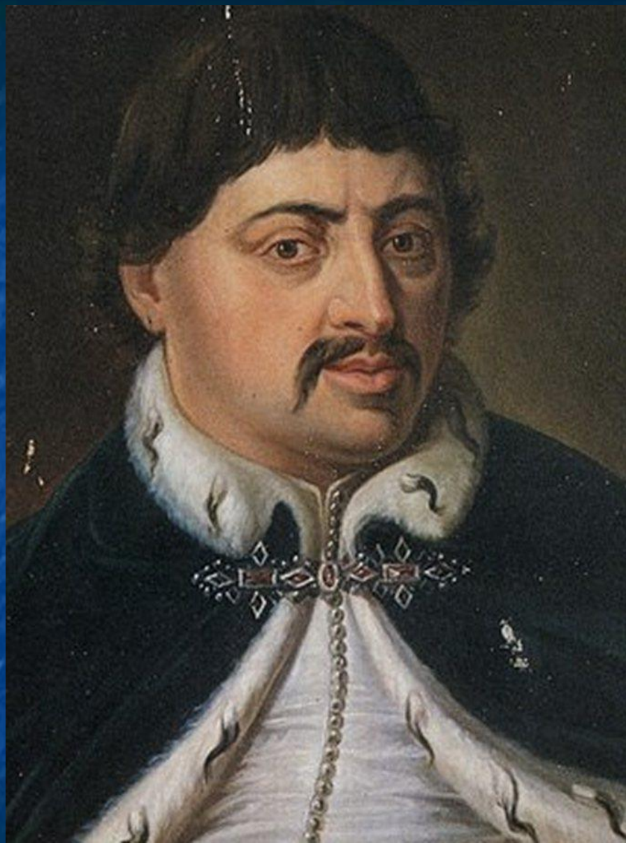
Портрет Василя Леонтійовича Кочубея (1640 -1708 рр.). Невідомий художник. XVIII ст.