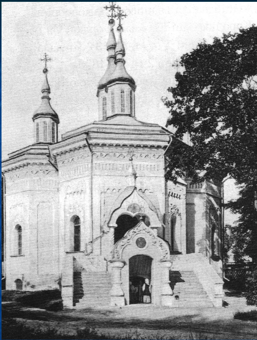
Домова церква Вознесіння Господнього в с. Дубовичі з книги В. Гурби «Дубовичі історико-красзнавчий нарис». Фото 1898 р.