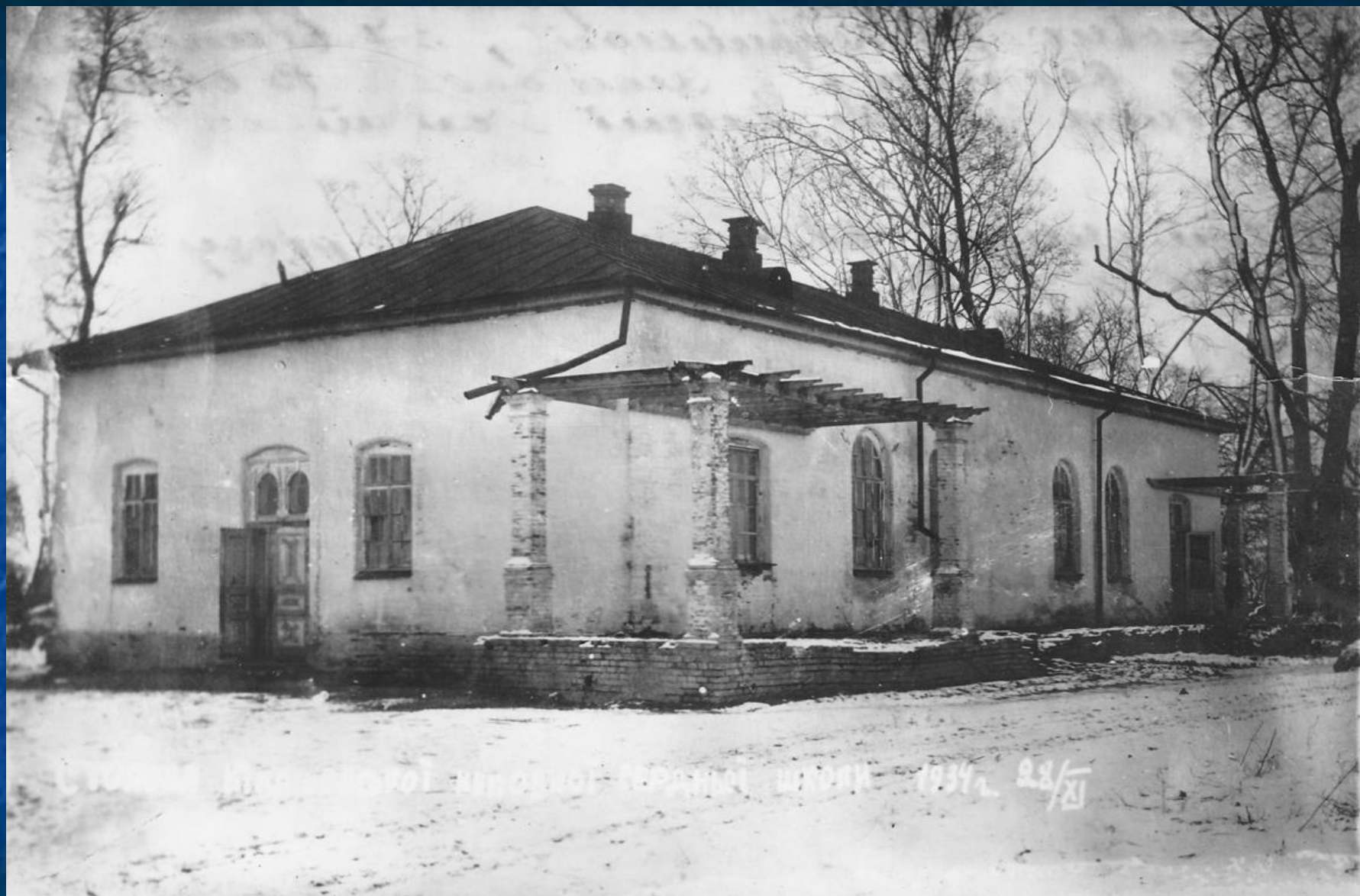
Приміщення Кинашівської школи, побудованої на кошти М.М. Кочубея.