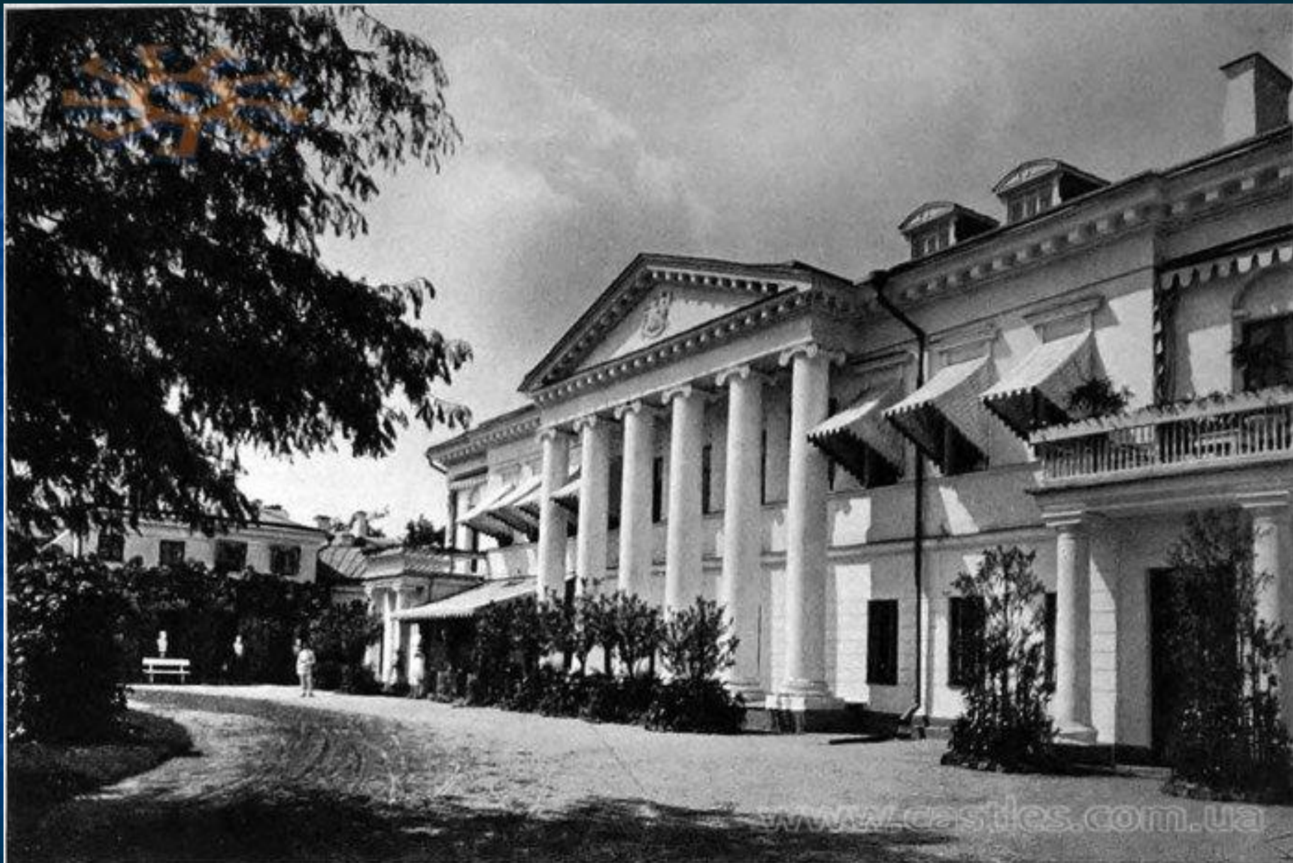
Палац Кочубеїв у Диканьці. Фото початку XIX ст.