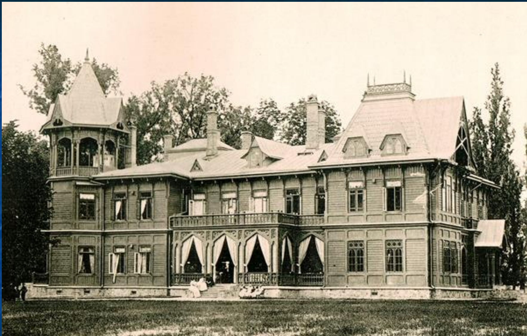
Будинок Кочубеїв в с. Дубовичі з книги В. Гурби «Дубовичі історико-краєзнавчий нарис». Фото 1898 р.