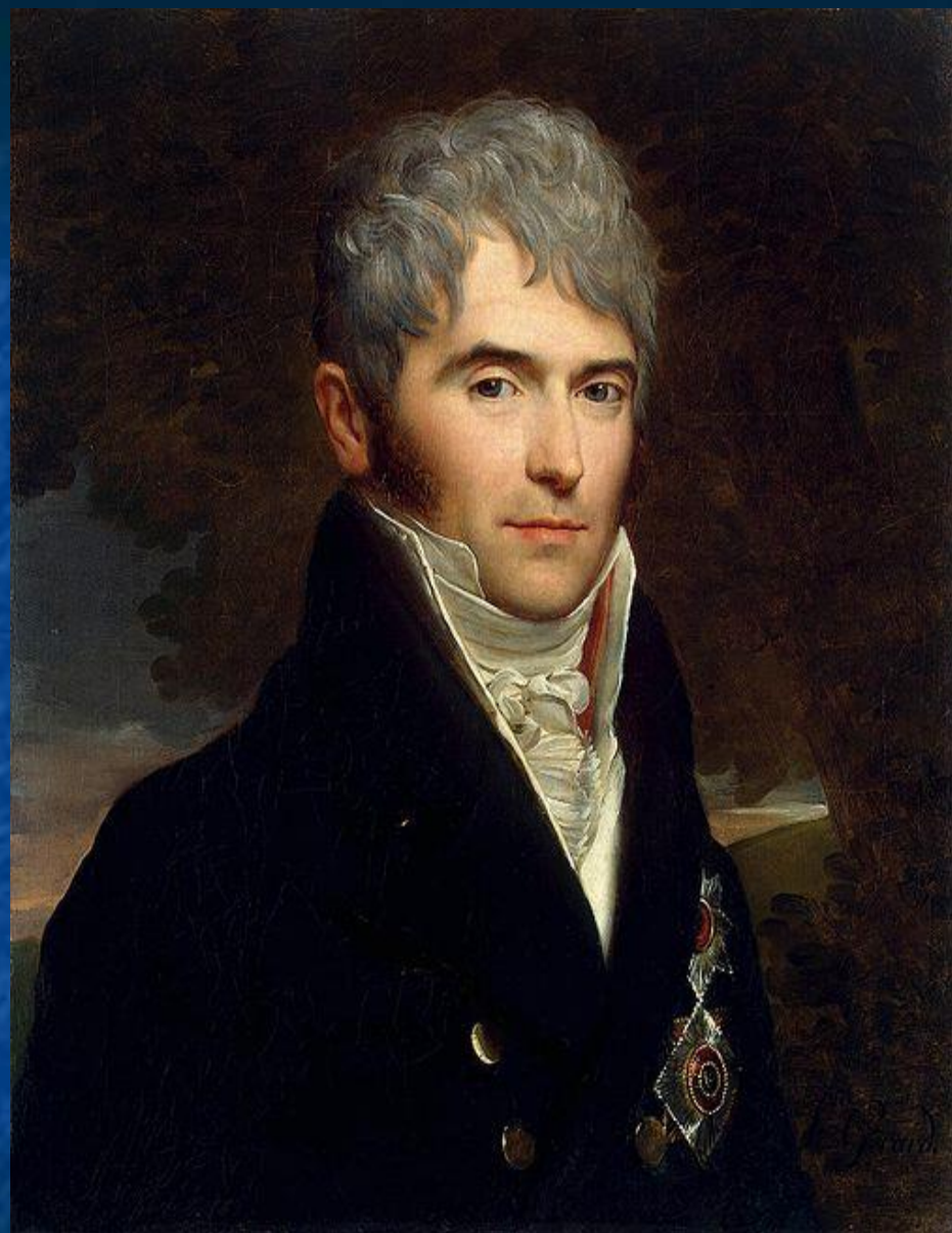
Портрет Віктора Павловича Кочубея (1768 - 1834 рр.). Художник Франсуа Паскаль Сімон Жерар. 1809 р.