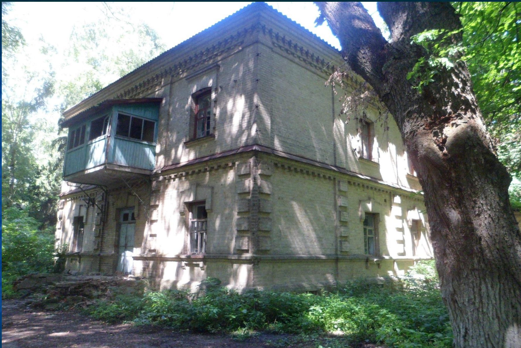
Скарбниця Кочубеїв в с. Тиниця. Фото 2011 р.