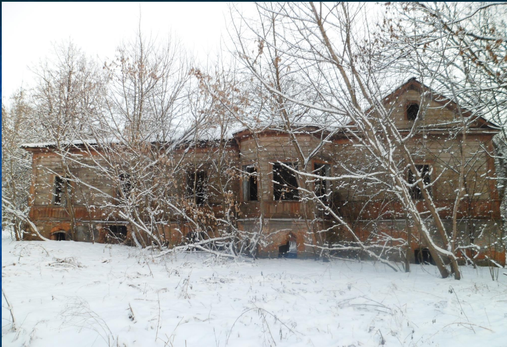
Будинок Кочубеїв в с. Ярославець. Фото 2012 р.