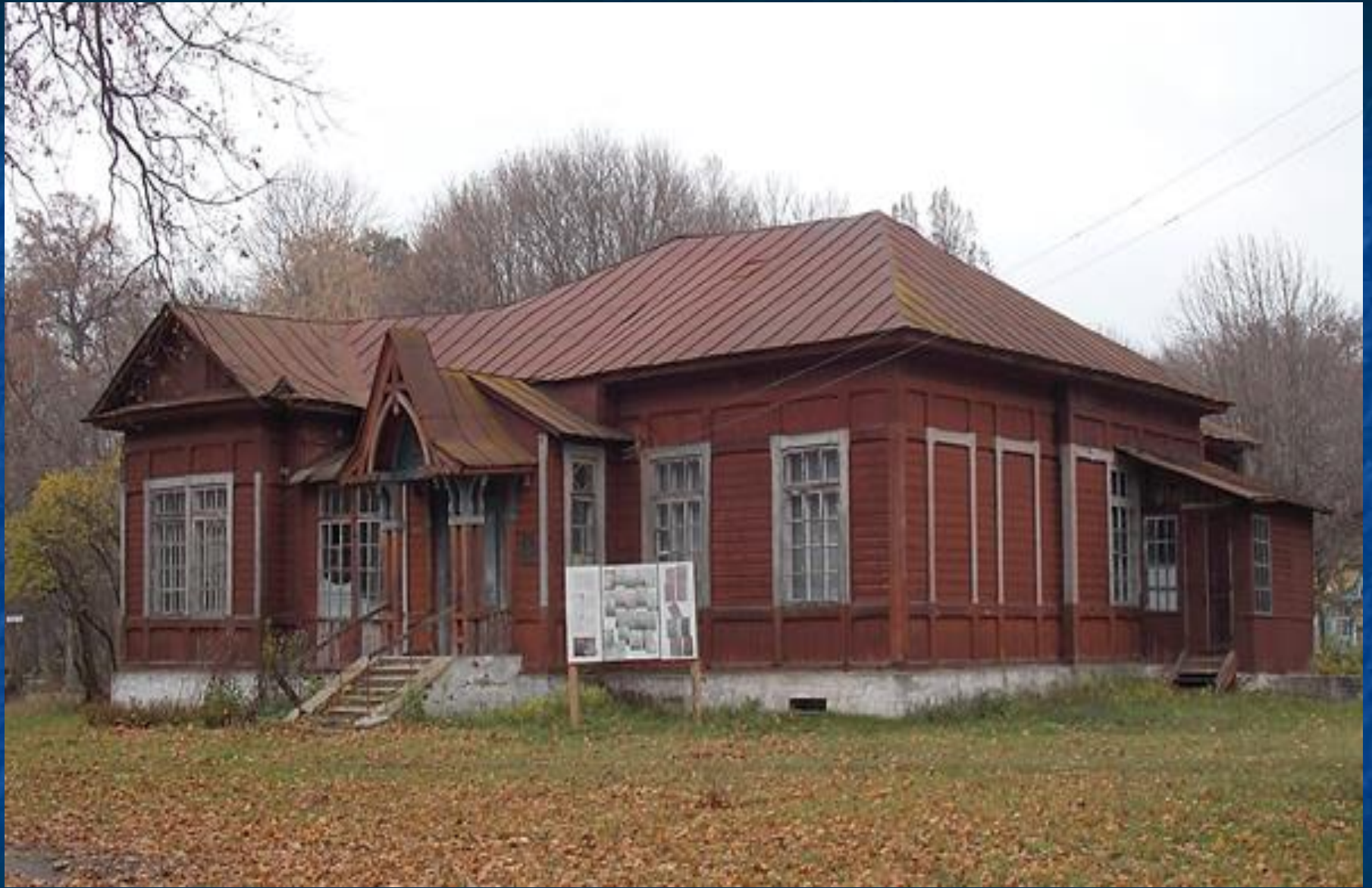
Будинок Кочубеїв в с. Дубовичі. Фото 2012 р.