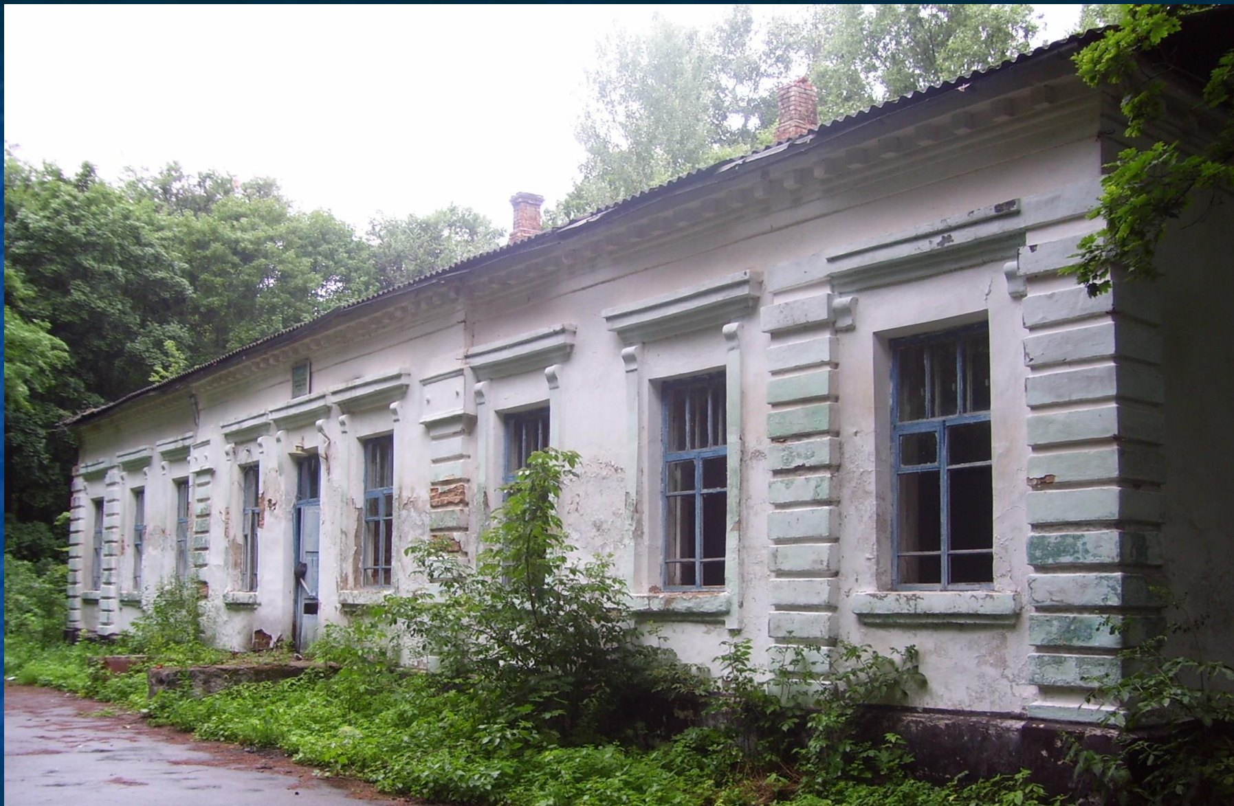
Будинок Кочубеїв в с. Тиниця.