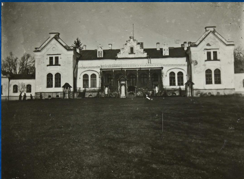
Палац Кочубеїв у Згурівці. Фото 1906 р.