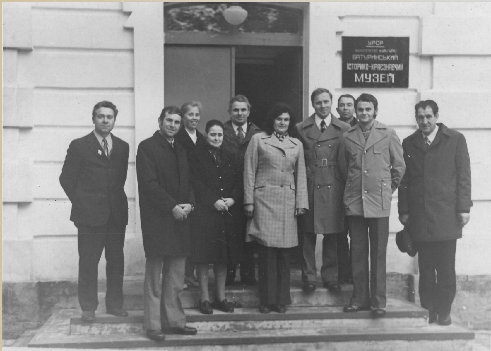
Гості Батурина відвідують музей, 1975 р.