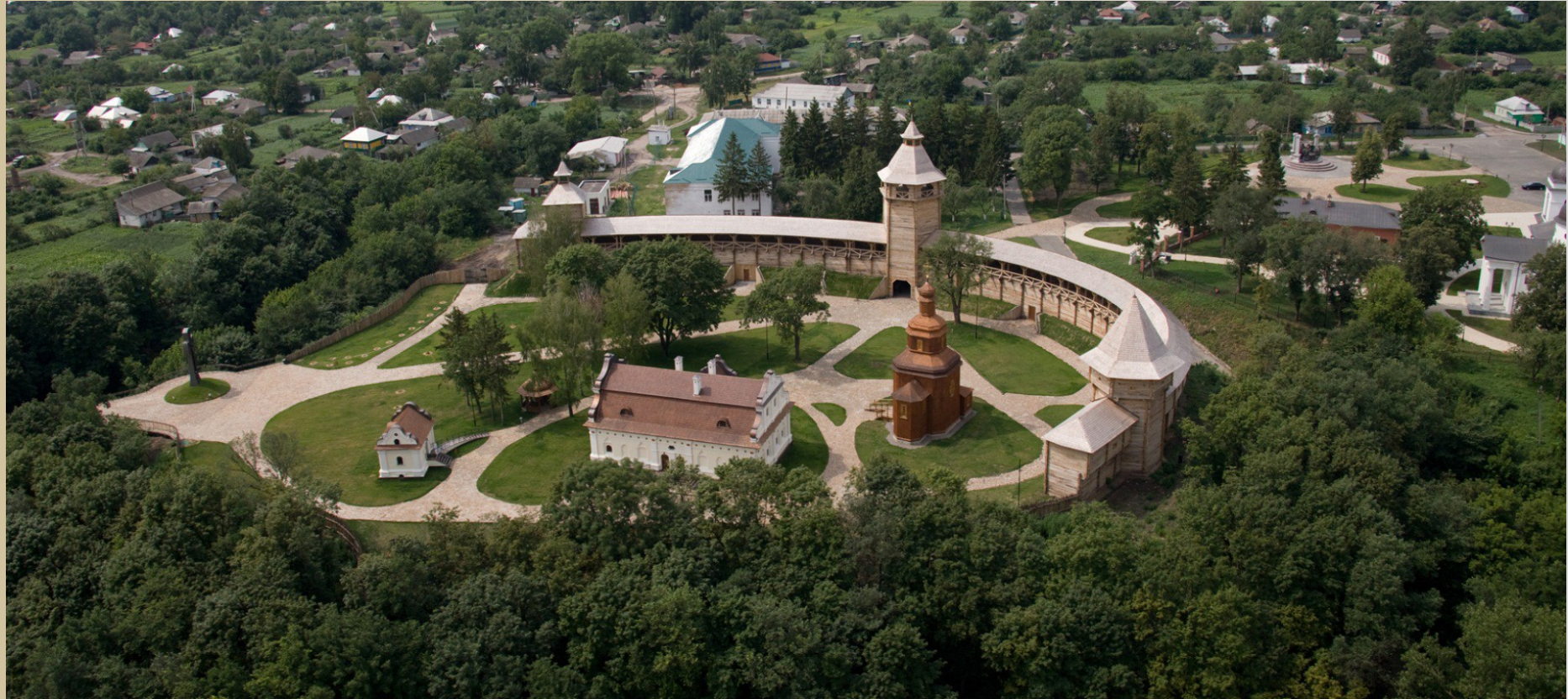
Цитадель Батуринської фортеці, фото 2009 року