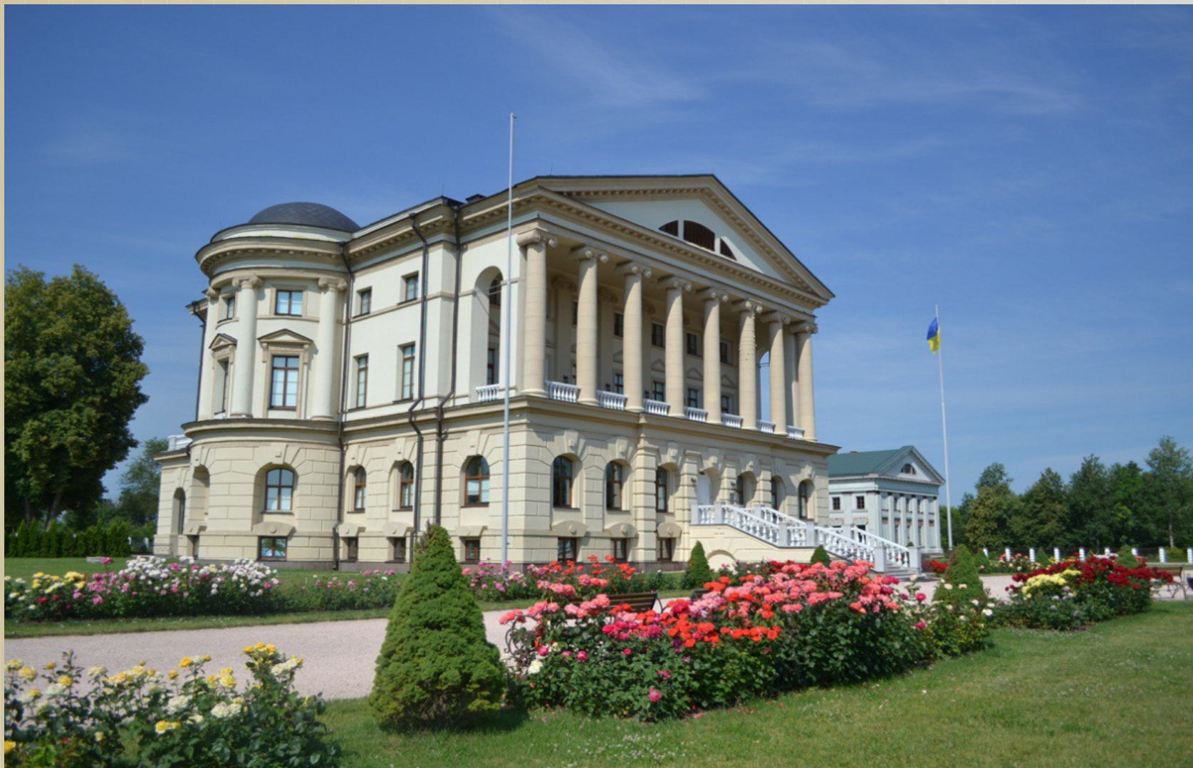
Палац К.Розумовського, фото 2013 р.