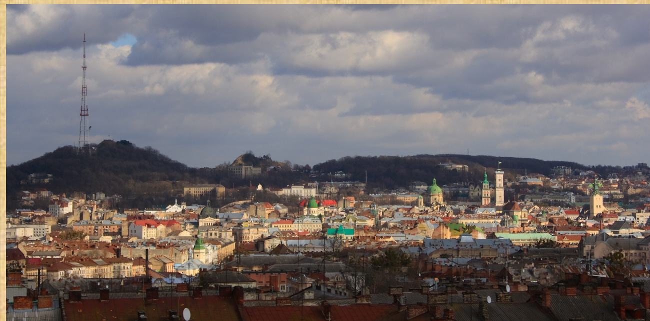
Панорама сучасного Львова. Фото 2007 р.

Недарма поляки скаржилися Петрові І у лютому 1707 року, адже І.Мазепа і справді заселив козаками території, які, згідно з Вічним миром, мали залишатися безлюдними.