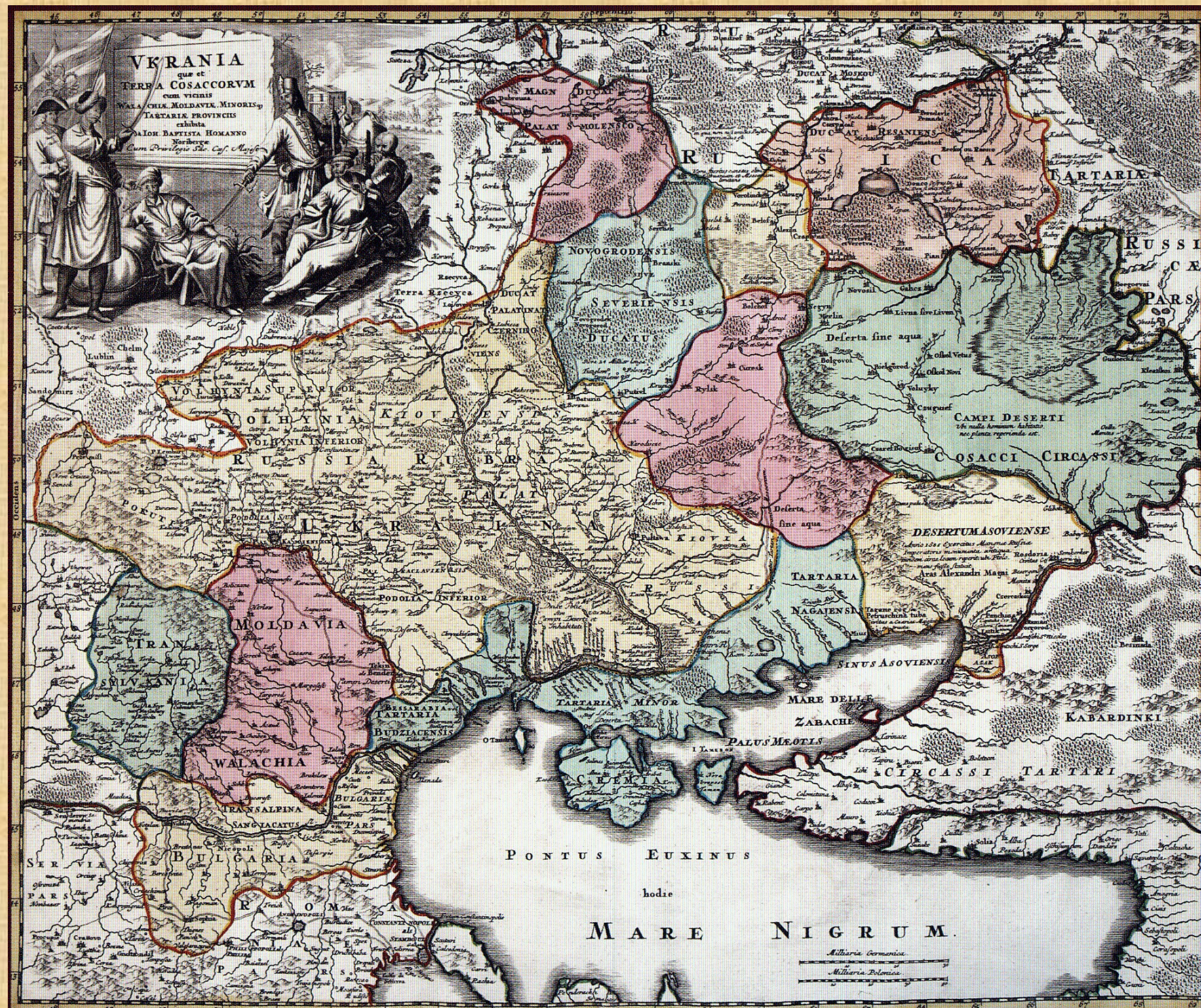
Мапа “Україна або козацька земля з прилеглими провінціями Валахії, Молдавії і Малої Татарії”. Іоганн Баптист Гоман, 1712р.

“Ліпше було пробувати Вкупі лихо одбувати!” Іван Мазепа