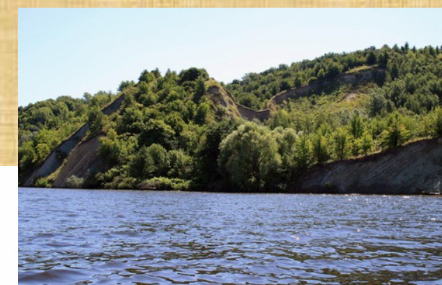
Дніпровські кручі поблизу історичного Трахтемирова. Фото 2009 р.