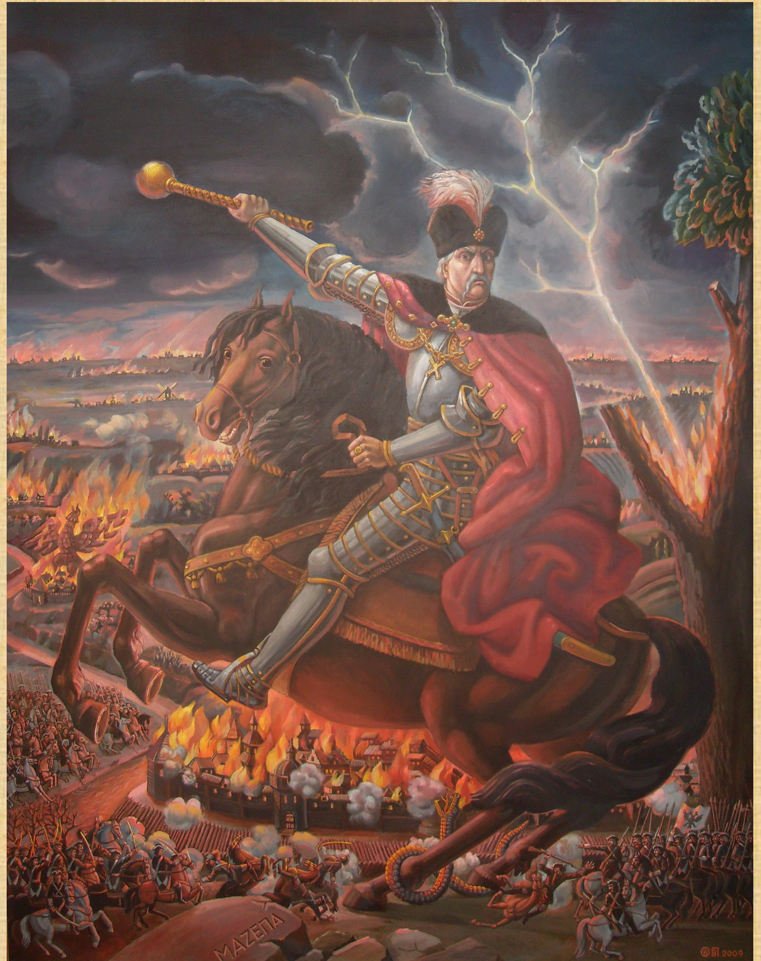
В.Прядка, О.Володимирова. Україна в огні, 2009 р.

Цар вважав поляків більш цінними для себе союзниками, тому на догоду їм ігнорував інтереси українців. Весною 1707 р. в Жовкві відбулася велика військова рада на якій московською владою було прийнято рішення про повернення полякам Правобережжя. Повністю ж Правобережжя було повернуто під польську владу тільки після поразки визвольного виступу гетьмана І.Мазепи у 1708-1709 роках.