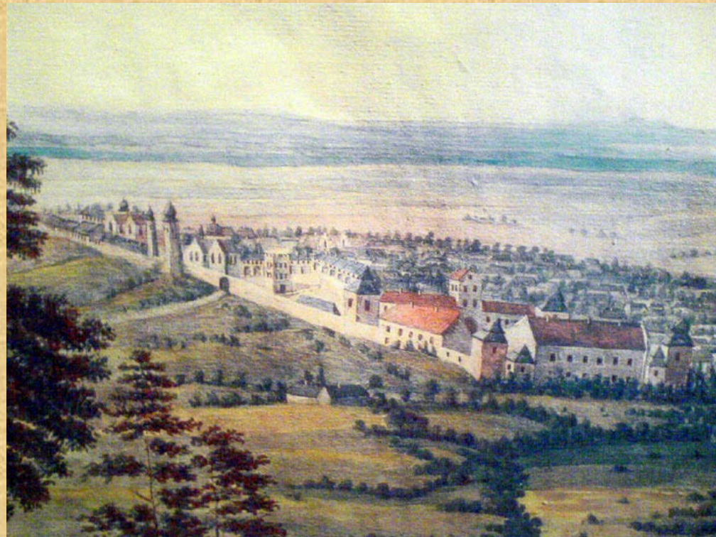
Жовква. Невідомий художник, XVIII ст.

Цар вважав поляків більш цінними для себе союзниками, тому на догоду їм ігнорував інтереси українців. Весною 1707 р. в Жовкві відбулася велика військова рада на якій московською владою було прийнято рішення про повернення полякам Правобережжя. Повністю ж Правобережжя було повернуто під польську владу тільки після поразки визвольного виступу гетьмана І.Мазепи у 1708-1709 роках.