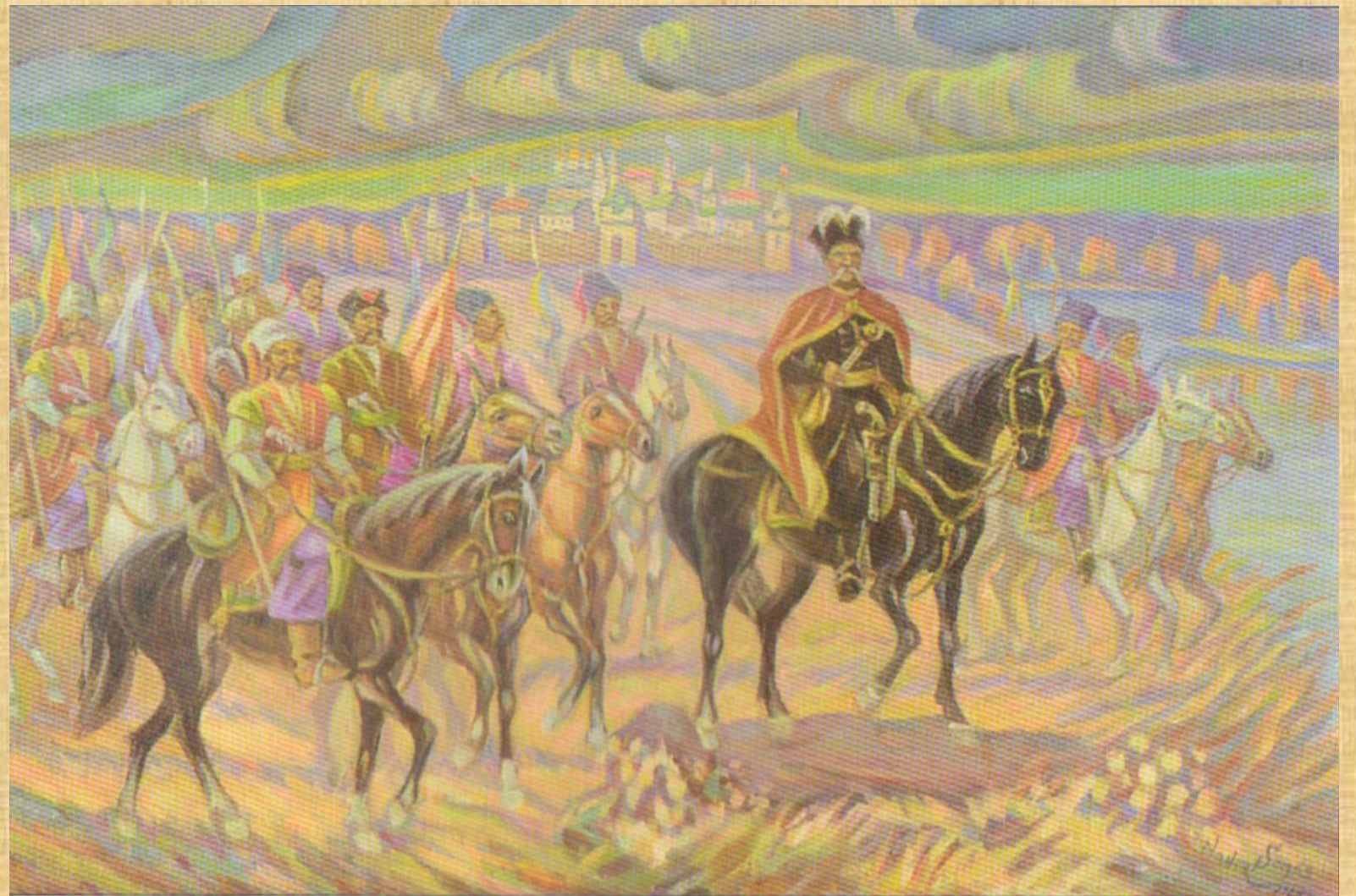
Виїзд гетьмана Мазепи з Батурина Надія Сомко, 1985 р.

На початок XVIII століття Україна була розділена між Річчю Посполитою, Московською державою та Османською імперією, потреба об'єднання була зрозуміла і тогочасним інтелектуалам і можновладцям.