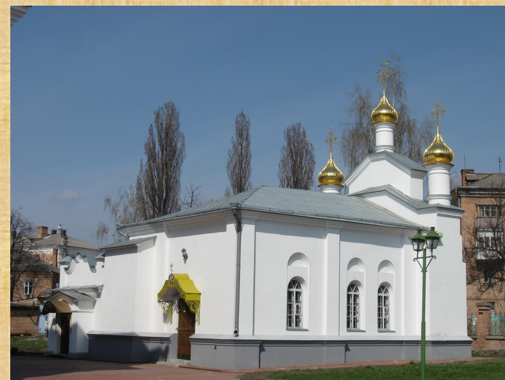
Микільська церква у Білій Церкві. Закладена 25 серпня 1706 р. Іваном Мазепою. Сучасне фото