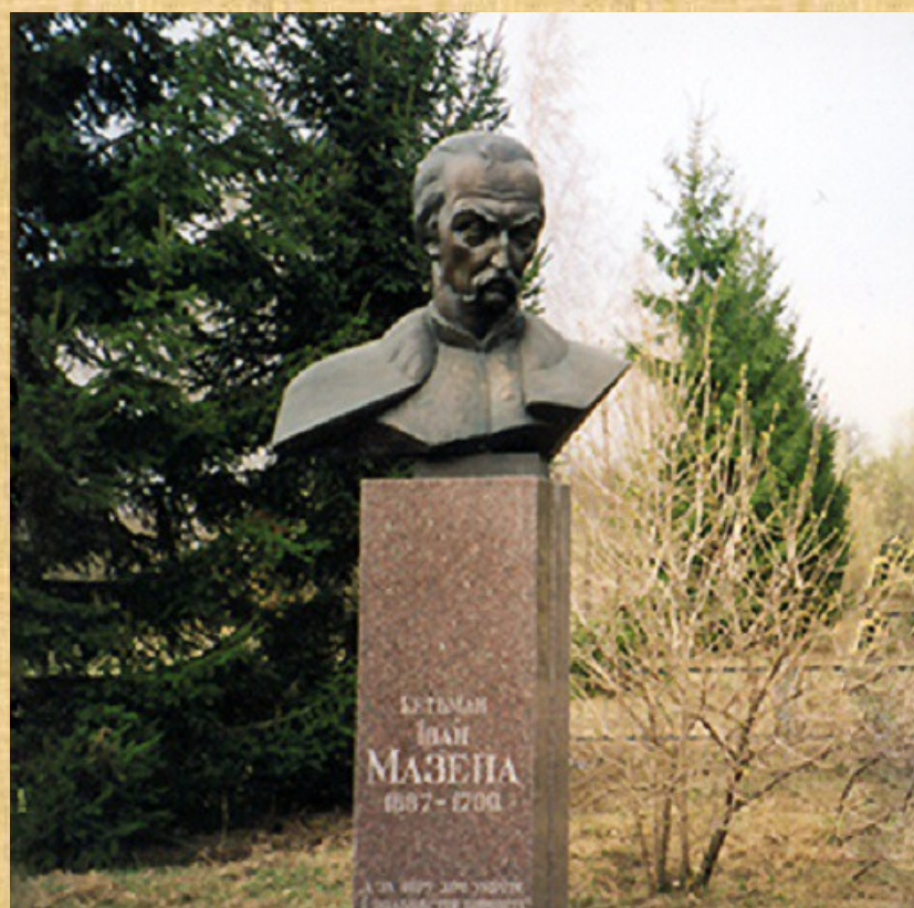
Пам'ятник гетьману І.Мазепі в селі Мазепинці, 1994р.

У Брацлавському, Київському і Подільському воєводствах Речі Посполитої був відновлений адміністративно-територіальний устрій Української Гетьманщини. Столицею нового краю мала стати – Біла Церква.