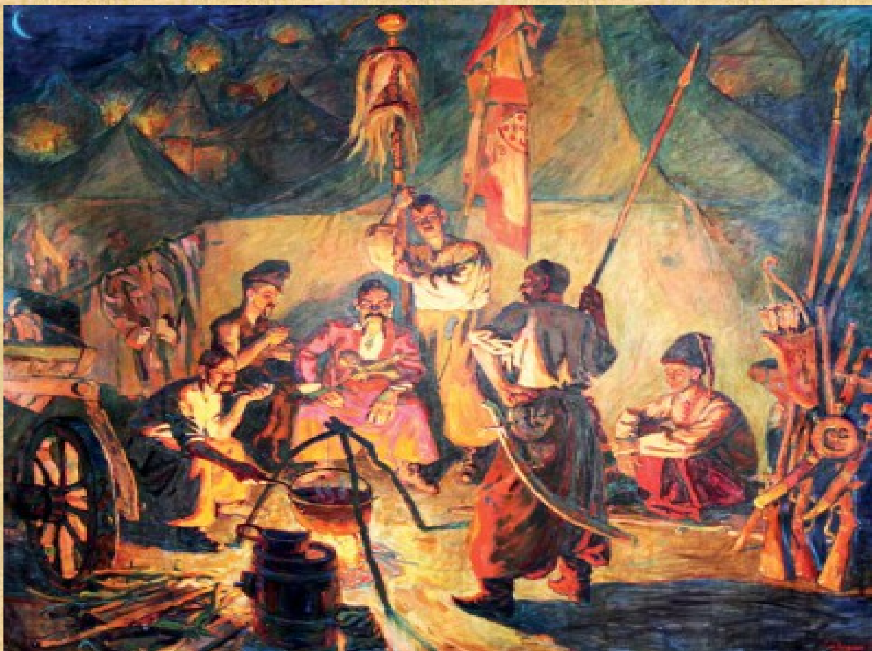
Козацька юшка або Батуринська сотня в поході. Юрій Северин, 2005р.

1700 року почалася Велика Північна війна (1700-1721), вона, як будь-яке велике потрясіння, не тільки принесла багато негараздів, а й відкрила вікно потенційних можливостей. Тепер гетьман вдається не тільки до дипломатії, а й до використання військової сили.