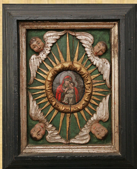
Ікона “Божа матір з немовлям” Подарунок І.Мазепи церкві міста Жовква. XVII ст. З фондової колекції НІКЗ “Гетьманська столиця”

На звільнених землях гетьман проводить цілісну інтеграційну політику та щедро вкладає кошти у відродження правобережних земель.