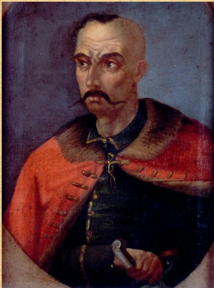
Семен Палій. Невідомий художник, XVIII ст.

На Правобережжі продовжувало існувати козацтво, під керівництвом фастівського полковника Семена Палія, та змогло відродити державні інститути, знищені у 70-х роках XVII століття. Правобережні козацькі полки намагались об'єднатися з Лівобережною Україною. І.Мазепа враховував ці прагнення до об'єднання і впливав на царський уряд з метою позитивного вирішення цього питання. Разом з тим, Москва не хотіла порушувати умови «Вічного миру» з Польщею й погоджувалася на володіння польським королем правобережними землями України.