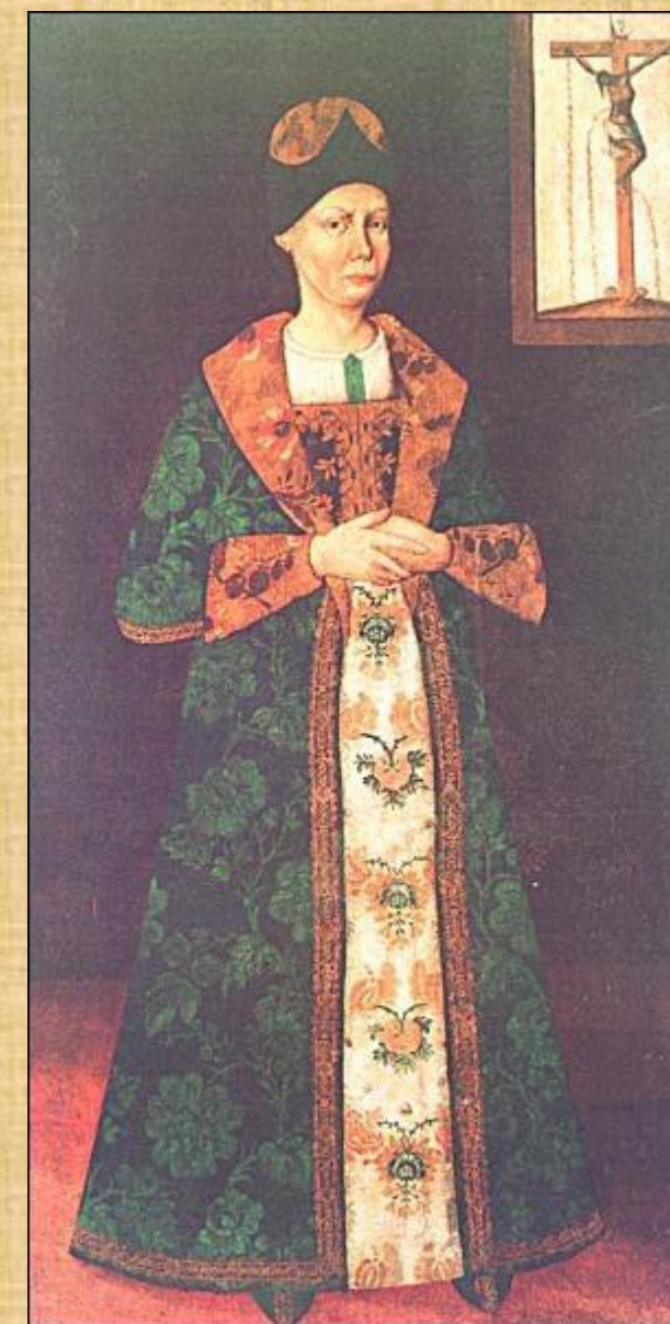
Портрет Марини Мазепи (в чернецтві Марія Магдалина). Невідомий художник, XVIII ст.

Гетьман обдаровує церкви. Наприклад під час перебування в Жовкві (нині Львівської області) він подарував місцевій церкві ікону Божої Матері.