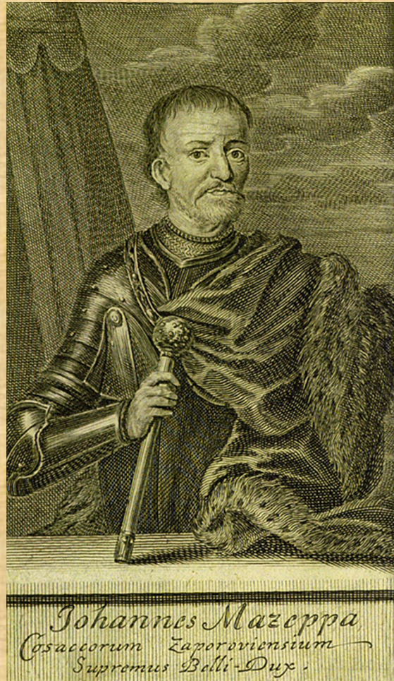
Портрет гетьмана Івана Мазепи. М.Бернігерот, XVIII ст.