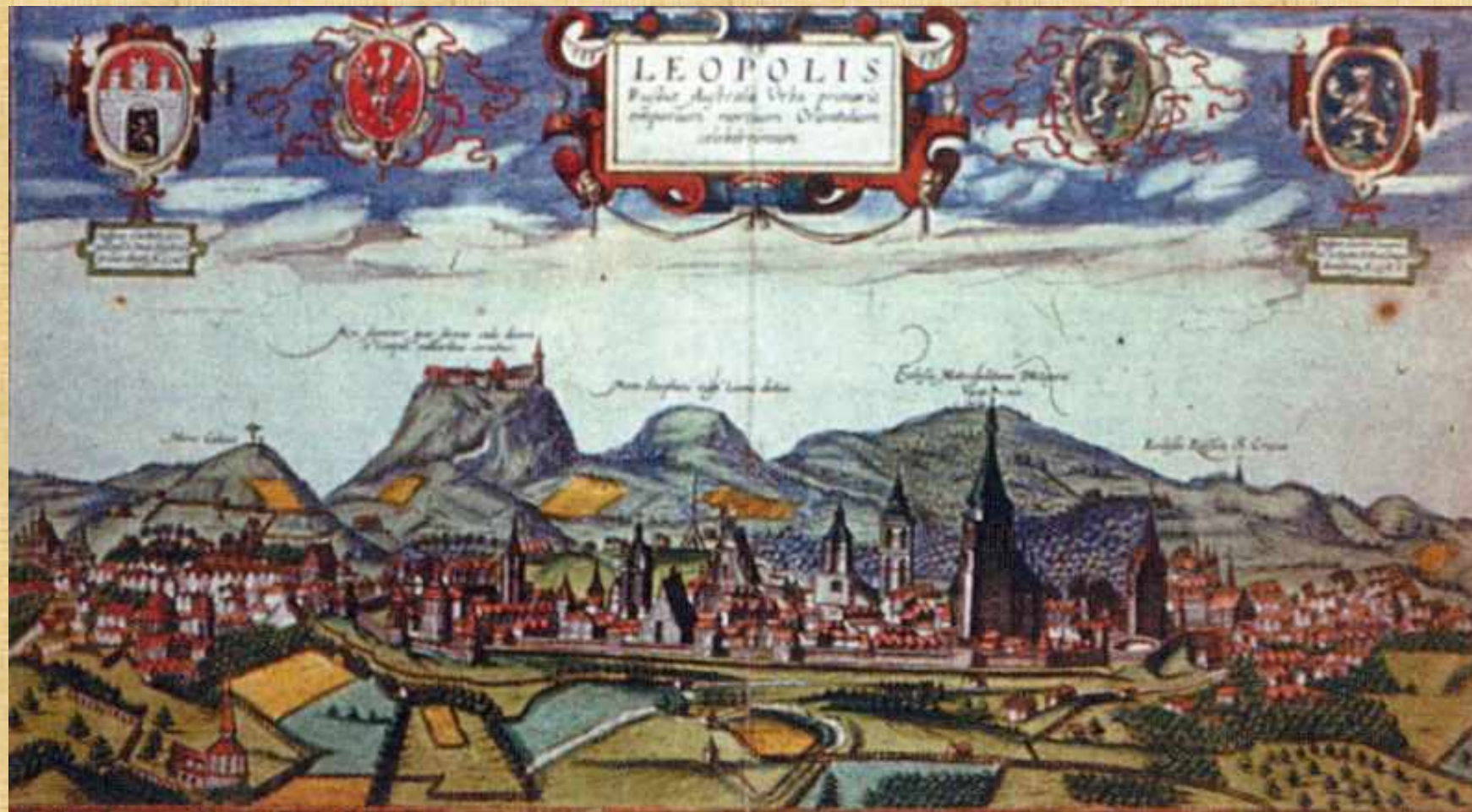
Львів XVIII ст. Антоніо Пасаротті, XVIII ст.

У 1705 році І.Мазепа здійснює звитяжний похід на Волинь та Галичину. Він ішов шляхом, пройденим свого часу Б.Хмельницьким, спостерігав ненависть українських селян і міщан до поляків і захоплене ставлення до себе. Польські урядовці втікали вглиб Польщі дізнавшись, що він переправився через Дніпро. Львів добровільно віддався під захист гетьмана.