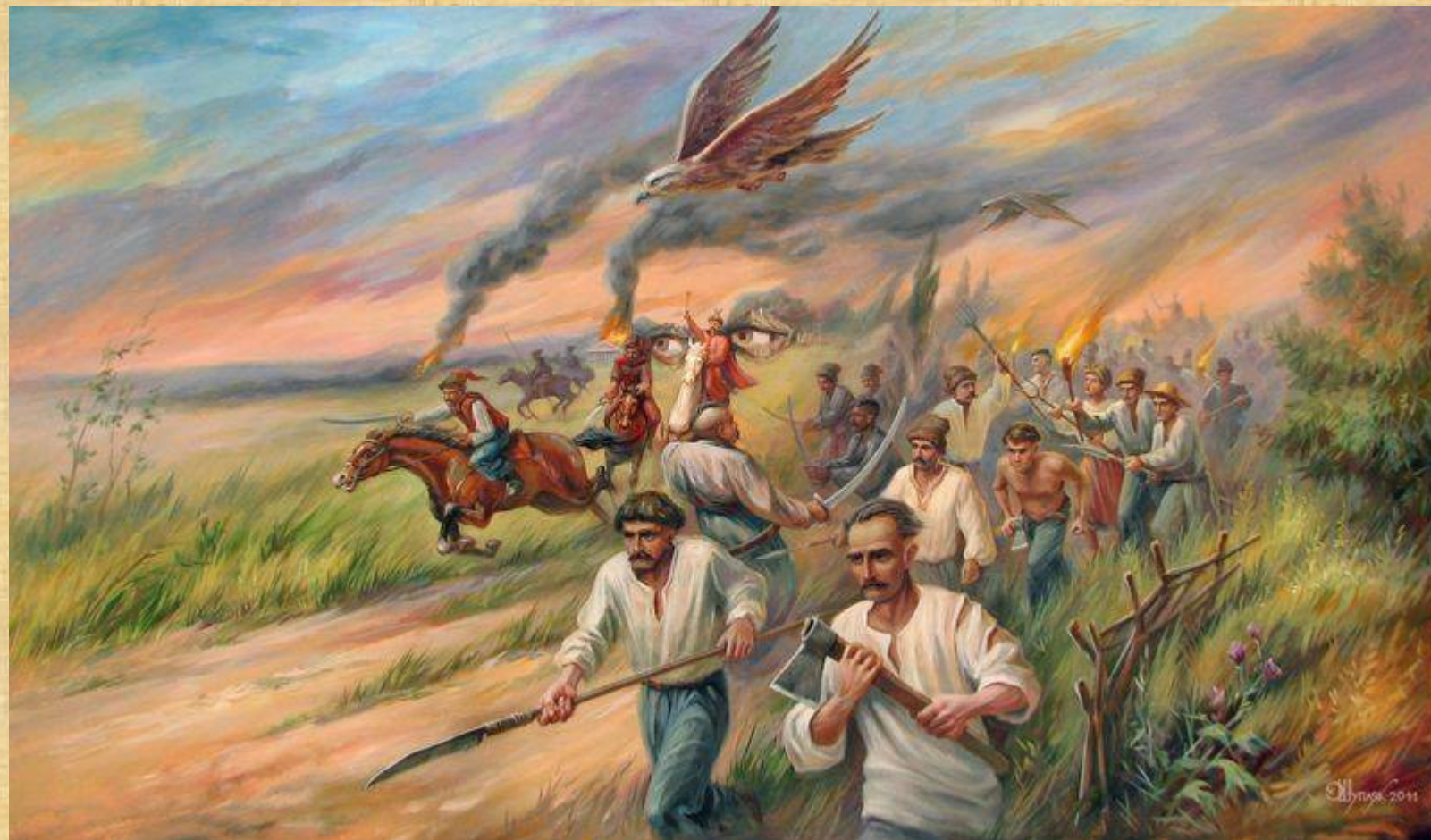
Повстанці. Олег Шупляк, 2011р.

Впродовж 1692 – 1693 років С.Палій знову звертався до І.Мазепи з проханням прийняти його «під гетьманську булаву». Крім того, посилаючись на лист С.Палія, гетьман І.Мазепа сповіщав російського царя про небезпеку нападу поляків і можливість народного повстання на Правобережжі, що також мало спонукати російський уряд звернути свою увагу на правобережні землі.