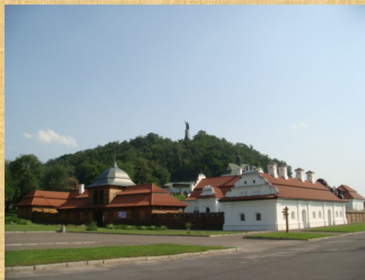
Реконструкція гетьманського двору в Чигирині. Фото 2012 р.