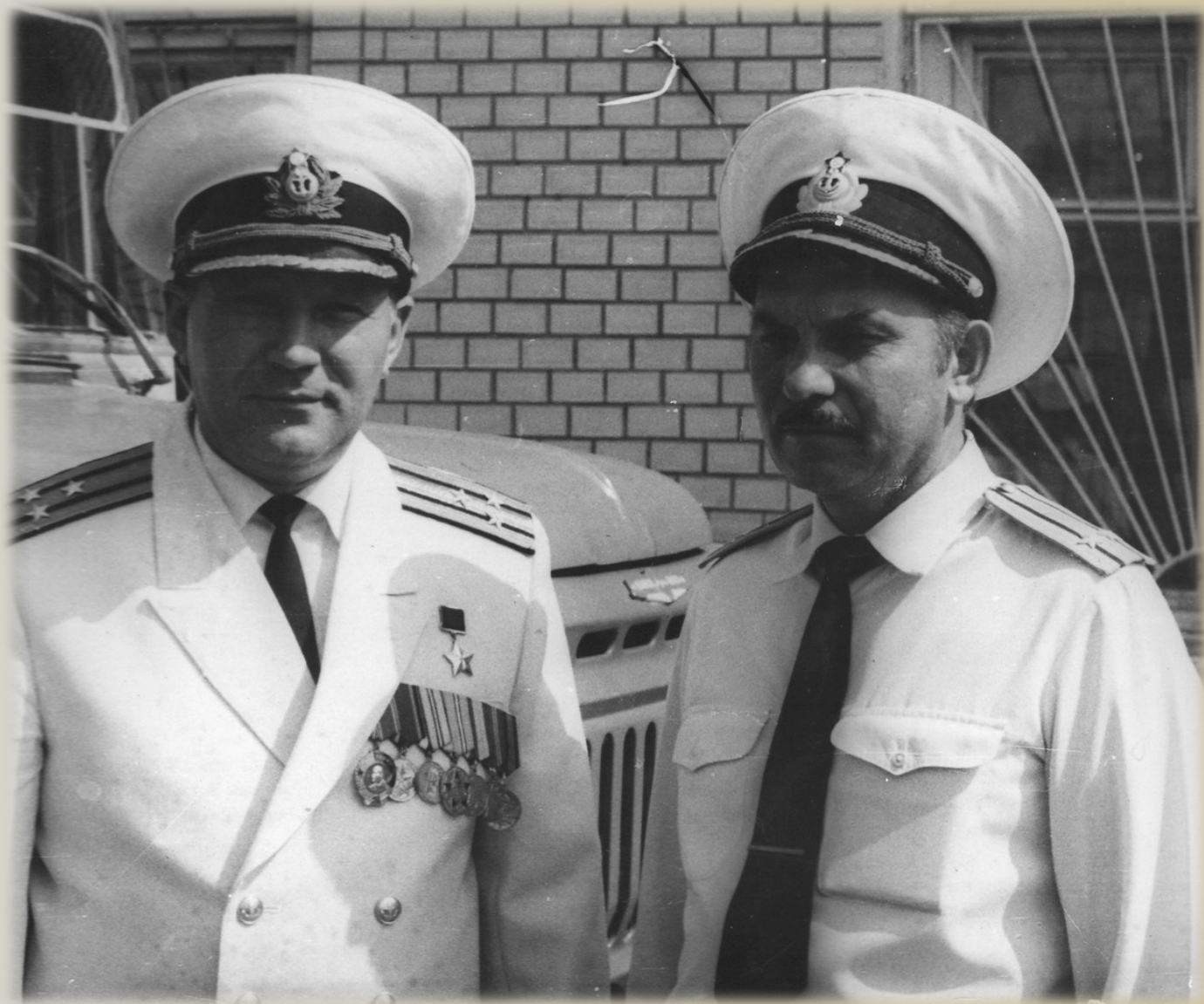
Герой Радянського Союзу В.Є.Соколов з товаришем, фото 80-х рр. XX ст.