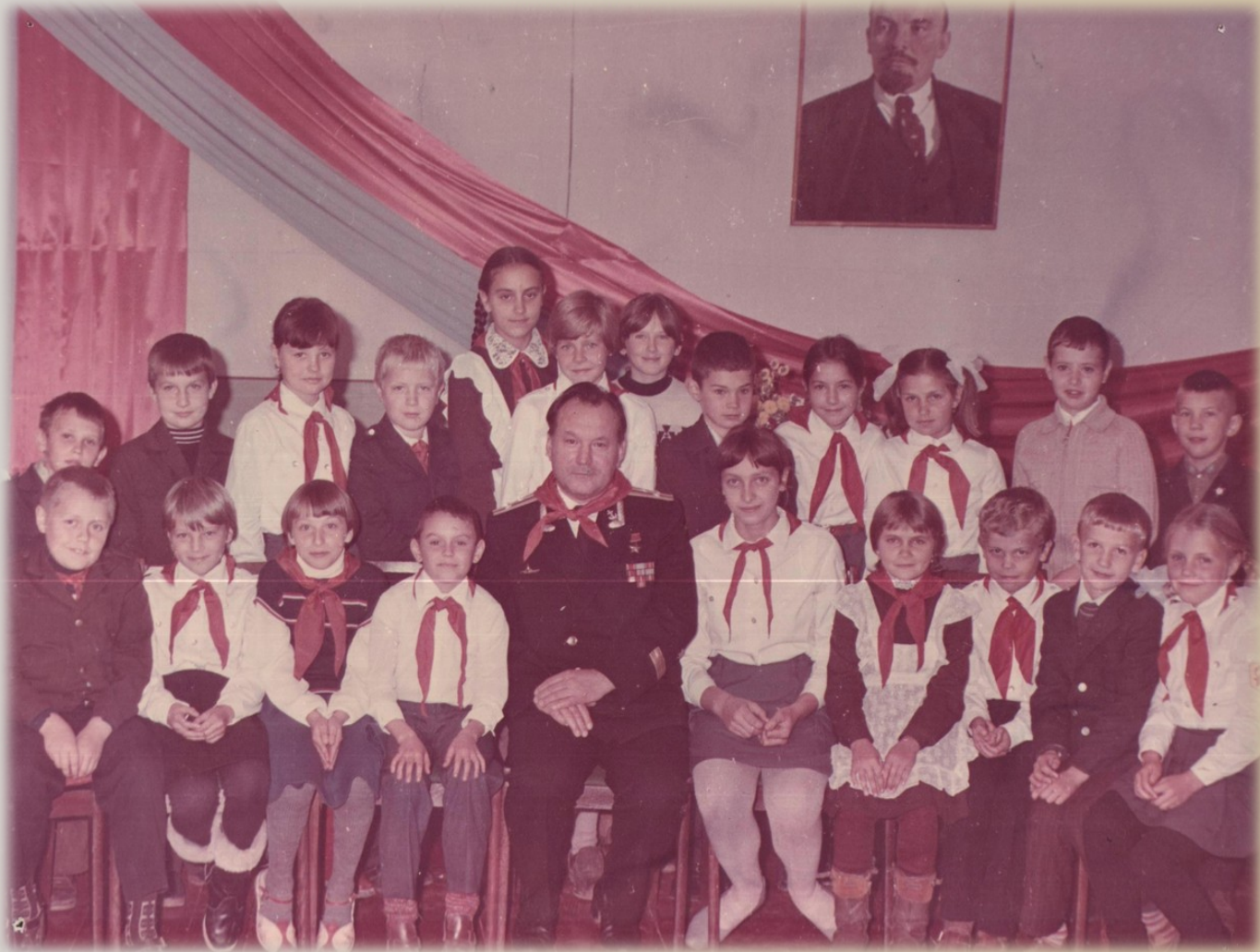
Урочистий прийом Героя Радянського Союзу В.Соколова в почесні піонери учнями Батуринської середньої школи, фото 1984 р.