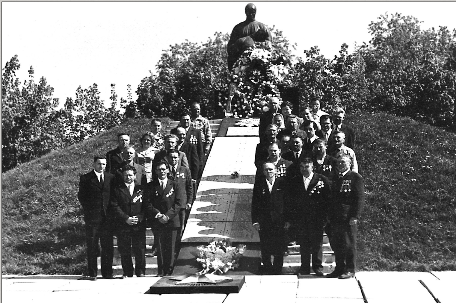
Ветерани Другої світової війни біля Кургана Слави, фото 1975 року.