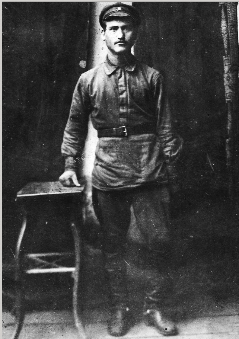
Червонящий Наум Васильович (1902 – 1943)